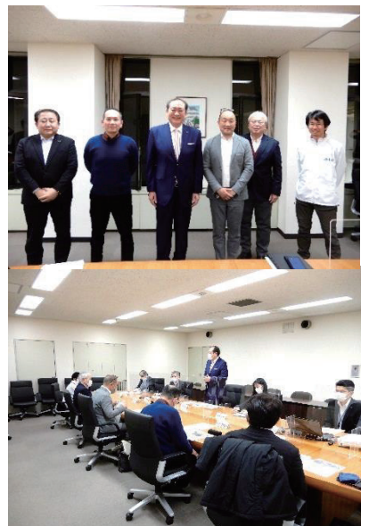
マルシエを開催している方々と 意見交換