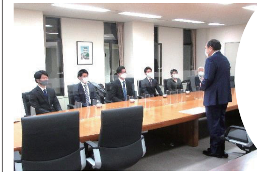
自衛隊入隊 入校予定者 表敬訪問