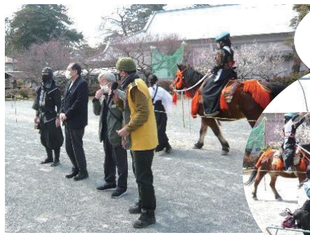
小田原城馬上 弓くらべ大会