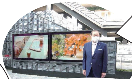
デジタルサイネージ オープニングセレモニー