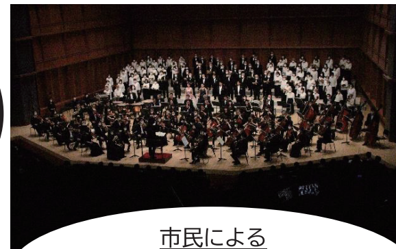
市民による 小田原音楽フェスティバル