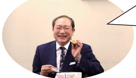
実際に試食しましたが、 餡にはみかんの皮が練り込まれ ていて小田原みかんの特徴で もある酸味のきいた素晴らしい どら焼きでした。