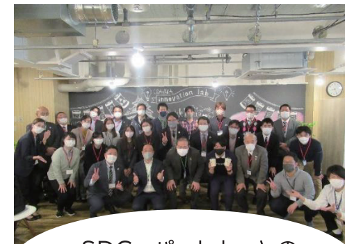
SDGs パートナーとの 課題解決ワークショップ