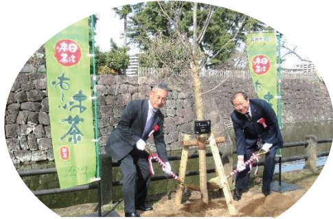
(株)伊藤園主催 桜植樹式