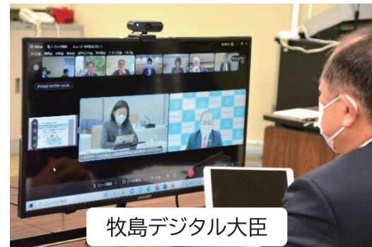
牧島デジタル大臣