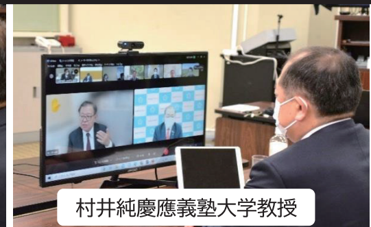
村井純慶應義塾大学教授