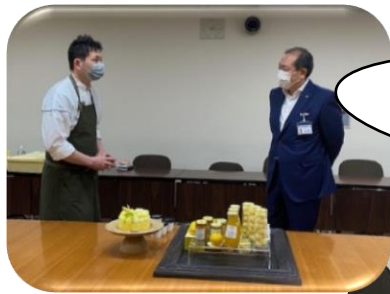
洋菓子店 MAISON GIVREE (メゾンジブレー)