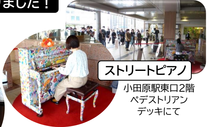
ストリートピアノ