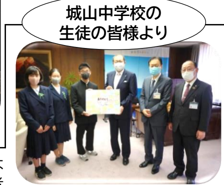
城山中学校の 生徒の皆様より