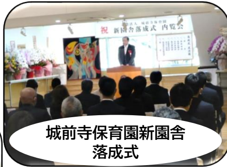
城前寺保育園新園舎 落成式