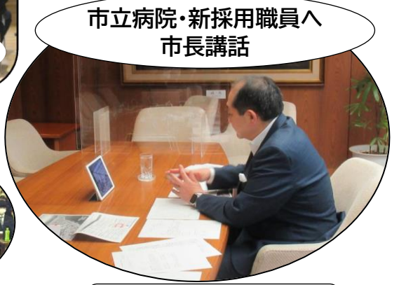
市立病院・新採用職員へ 市長講話