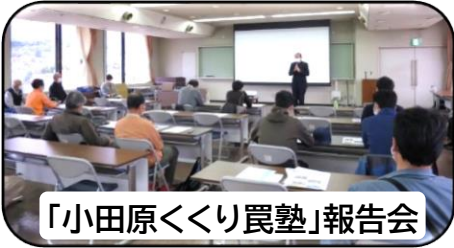
「小田原くり畷塾」報告会