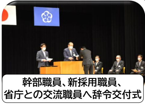
幹部職員、新採用職員、 省庁との交流職員へ辞令交付式