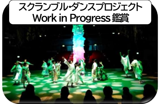
スクランブル・ダンスプロジェクト Work in Progress 鑑賞