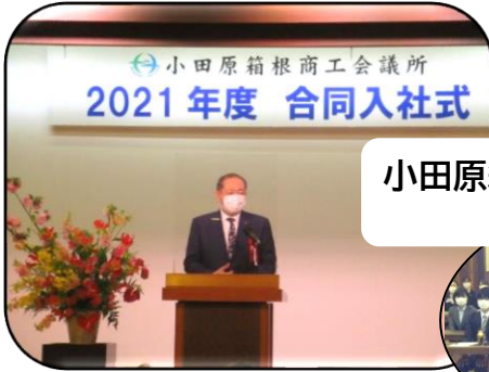
小田原箱根商工会議所 2021年度 合同入社式