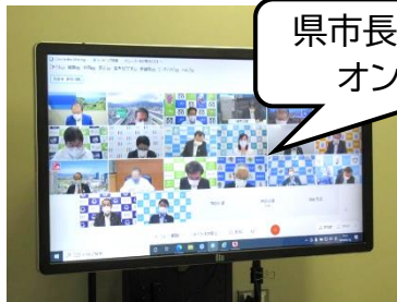
県市長会及び県主催 オンライン会議

「おだたん人間成長講座(社会の形成者としての役割)」で講義いたしました。6月に配信されます。