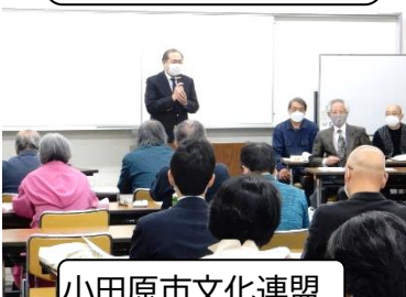
小田原市文化連盟