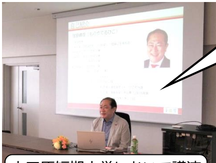
小田原短期大学において講演 (ビデオ収録)

「おだたん人間成長講座(社会の形成者としての役割)」で講義いたしました。6月に配信されます。