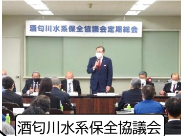
酒匂川水系保全協議会

今年はいくつかの団体が感染防止対策を徹底した上で、総会を開催しております。書面やオンラインでの開催方法もありますが、やはり対面で行う形式も必要ではないかと改めて感じました。