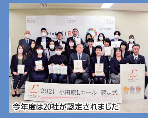
2021 小田原シエール 認定式 今年度は20社が認定されました