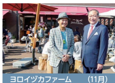
ヨロイツカファーム（11月）