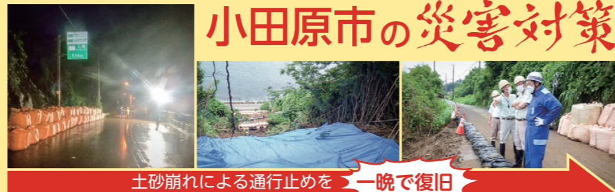
土砂崩れによる通行止めを