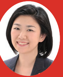
10月4日に発足した岸田文雄内閣で、神奈川17区選出の牧島かれん衆議院議員(44)＝自由民主党、当選3回＝がデジタル大臣として初入閣を果たした。行政改革担当大臣、内閣府特命担当大臣(規制改革)も兼務する。