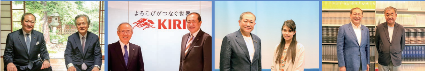
（株）三菱総合研究所 小宮山 宏 理事長

ポストコロナ社会における市政の在り方について各分野で活躍する有識者と対談を行い、様々な意見を伺いました。