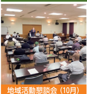
地域活動懇談会（10月）