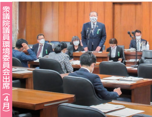
衆議院議員環境委員会出席（4月）