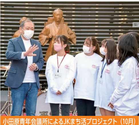
小田原青年会議所によるJKまち活プロジェクト（10月）