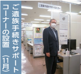
ご遺族手続きサポート コーナーの設置（11月）