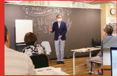
スマートフォン教室