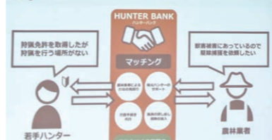
小田急電鉄（株）と「ハンターバンク」連携（11月）