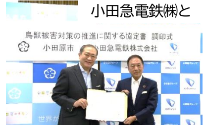
「鳥獣被害対策の推進に関する協定」締結 (11.10)