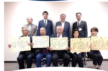
防犯功労団体・防犯功労者等 表彰伝達式(10.19)