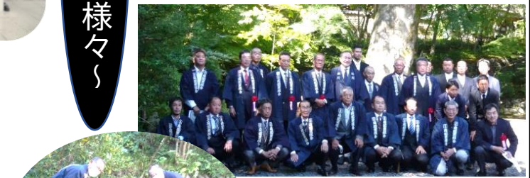
小田原庭園業組合 創立115周年記念 植樹式(10.23)