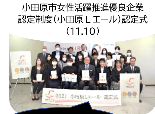
小田原市女性活躍推進優良企業 認定制度(小田原Lエール)認定式 (11.10)