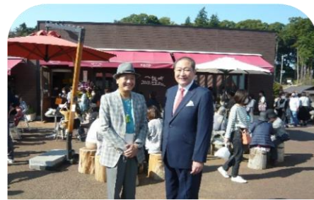
一夜城ヨロイツカ・ファーム 10周年祭 (10.19)