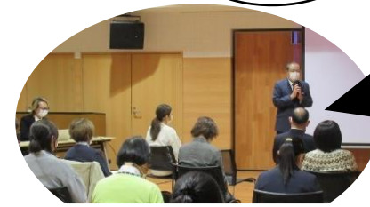
幼児教育・保育の質の向上に向けた意見交換会 (10.25)

現場に行かなければわからないことが沢山あります。あらためて意見交換会の大切さを感じました。