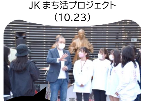
JKまち活プロジェクト (10.23)