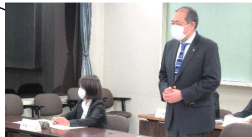
市民と市長との地域活動懇談会 芦子地区まちづくり委員会 (10.19)

これまで何度か懇談会を開催しておりますが、パワーポイントを用いたプレゼンテーションは初めてでした。地域活動もどんどん進化しています。まちづくり委員会からは、防災、交通安全、防犯、福祉、環境、地域交流など幅広い報告をいただきました。いくつかの地域は、ごみ集積場所の管理が課題になっているようです。