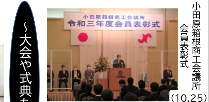
小田原箱根商工会議所 会員表彰式 (10.25)