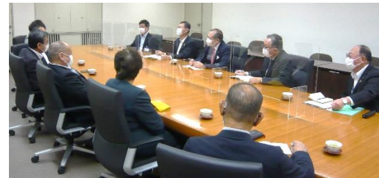
小田原市議会の会派代表者と特別職との意見交換会 (10.28)