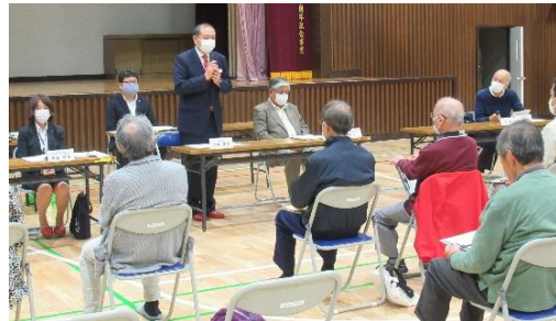
市民と市長との地域活動懇談会 山王網一色地区(10.19)

どの地域でもコロナ禍での地域活動にご苦労されていますが、今ある環境の中で、無理せずに活動を継続することが重要だと思います。総合計画に関心を持ってくださる方もおられたので、様々な政策をお伝えしました。地域的に津波や越波への関心が非常に高いようです。関係機関と連携を図りながら対策を進めてまいります。