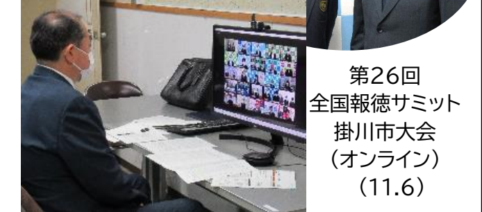
第26回 全国報徳サミット 掛川市大会 (オンライン) (11.6)