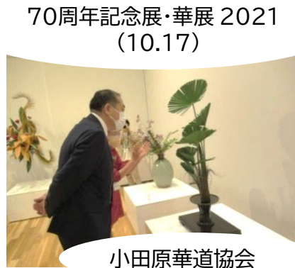
70周年記念展・華展 2021 (10.17)