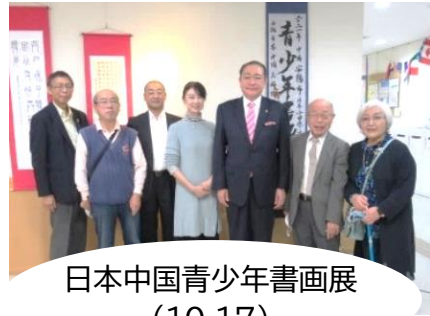
日本中国青少年書画展 (10.17)