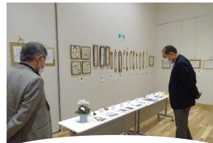
第26回西さがみ文芸展覧会 (10.31)