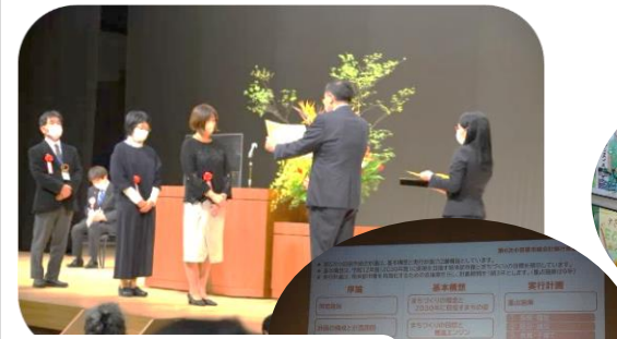
第52回小田原市民生委員 児童委員大会 (10.19)