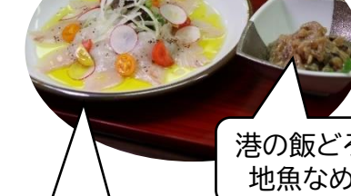
港の飯どろぼう 地魚なめろう