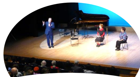
小田原シャンソン・カルナバル (11.3)