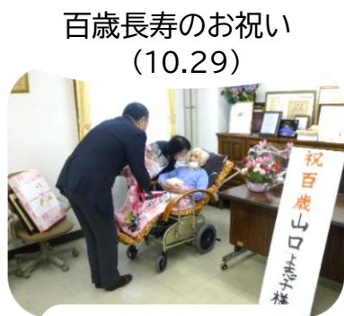
百歳長寿のお祝い (10.29)