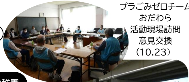
プラごみゼロチーム おだわら 活動現場訪問 意見交換 (10.23)