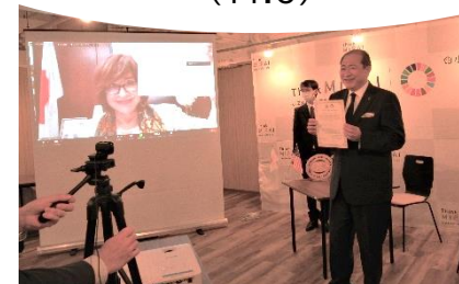
チェラビスタ市との海外姉妹都市 提携40周年オンライン記念式典 (11.6)