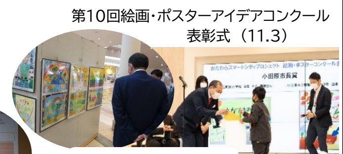
第10回絵画・ポスターアイデアコンクール 表彰式 (11.3)